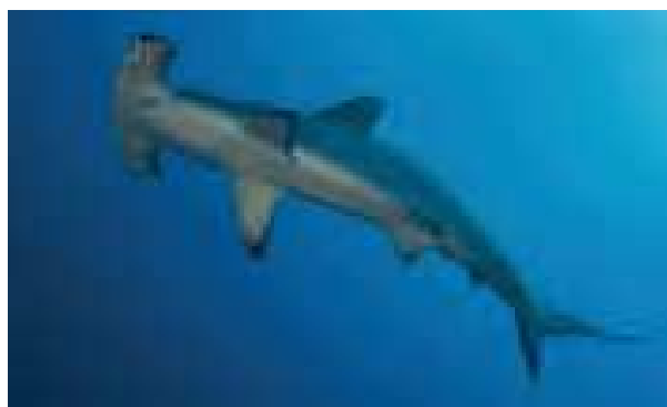
Haie - hier Hammerhaie - haben zu Unrecht ein Monsterimage